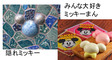
みんな大好き ミッキーまん

参加してくれた皆さん、お疲れ様でした。また、来年、皆さんと塾旅行に行ける事を楽しみにしています。